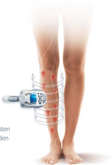
Ihonaisten laskimoiden verkosto